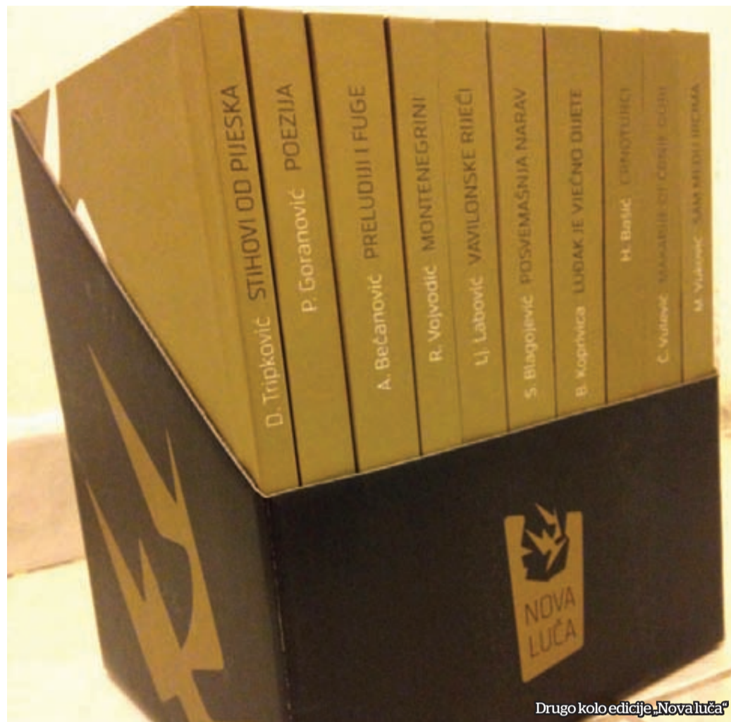
Drugo kolo edicije „Nova Luča“

jezik i književnost, Nacionalne biblioteke Crne Gore „Đurđe Crnojević“ i Zavoda za udžbenike i nastavna sredstva. Pokrovitelj projekta je Ministarstvo kulture Crne Gore.